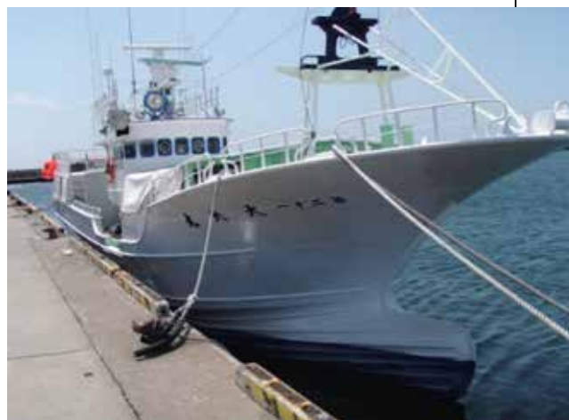
Рисунок 2. Судно для промысла донными жаберными сетями типа «Тайко-мару» в порту Хабомаи округ Нэмуру

Известный г. Кусиро восточного Хоккайдо в конце XX в. из захолустной деревни превратился в процветающий город. В период с 1969 по 1977 годы порт Кусиро был в Японии портом № 1 по выгрузкам рыбы. В 1980-е годы, благодаря высокой численности сардины иваси, в порт выгружали ежегодно (с 1983 по 1987 годы) более миллиона тонн этой рыбы. Рекорд был поставлен в 1987 г. – 1,33 млн т. сардины иваси [4]. Эту рыбу нужно было принимать в портах, перегружать, транспор-