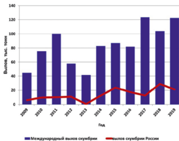
Рисунок 4. Динамика вылова скумбрии Scomber colias в зоне Мавритании в 2009-2019 годы

Начиная с 1990 г., когда была введена 200-мильная ИЭЗ, регулирование рыболовства в водах На-