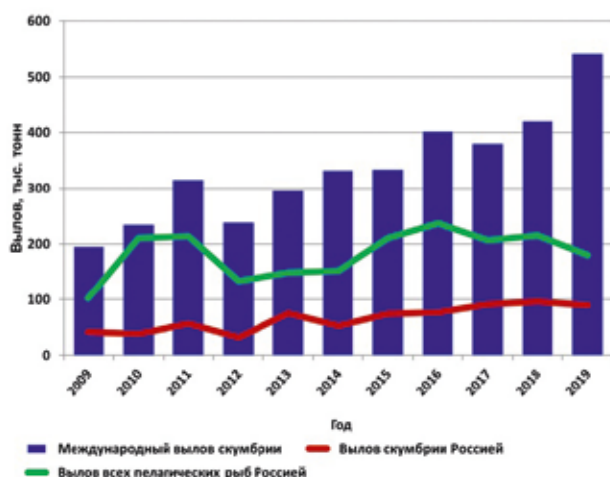
Рисунок 5. Динамика вылова скумбрии Scomber colias и других пелагических видов рыб в Центрально-Восточной Атлантике в 2009-2019 годах

Ввиду того, что общий вылов скумбрии в ЦВА всеми странами с 2016 г. превышает рекомендации Рабочей группы и результаты собственных исследований [16], где данная величина несколько больше оценки верхней границы ОДУ (499 тыс. т) и превышает оценку MSY по наиболее достоверной модели (285 тыс. т), появляется возможность резкого снижения продуктивности популяции скумбрии ЦВА, что в конечном счете может привести к экономическим потерям. При этом регулирование популяции, основанное на принципах предосторожного подхода и максимизации устойчивого улова, предполагает поддержание биомассы на уровне свыше 1,7 млн т, что позволило бы гарантировать продуктивность не ниже 283 тыс. т, а при благоприятных условиях – и до 499 тыс. тонн.