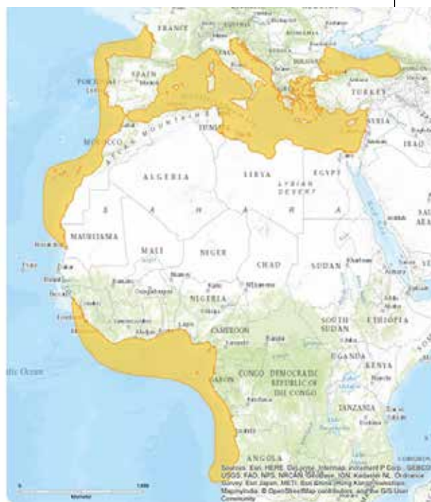
Рисунок 2. Ареал распространения скумбрии Scomber colias , Gmelin 1789

Некоторое снижение среднего веса рыбы с глубиной может быть обусловлено ухудшением условий обитания, при почти равной средней длине, скумбрия на глубинах от менее 50 до более 400 м может иметь меньший средний вес, потому что находится вне зоны интенсивного откорма, т.е. Канарского апвеллинга. Таким образом, скумбрия ЦВА обитает преимущественно в прибрежных районах. Наиболее оптимальными для особей этого вида глубины 0-100 метров. На глубоководных участках (более 400 м) скумбрия встречается относительно редко, а масса таких особей значительно низкая.