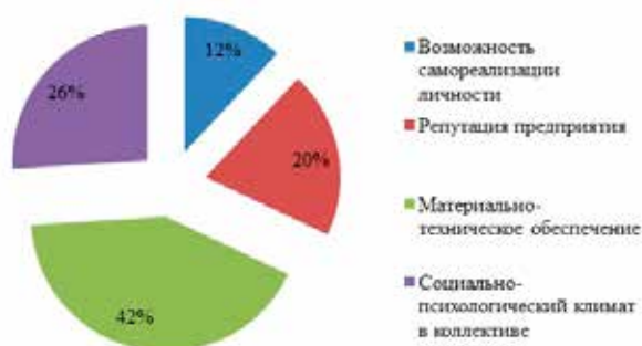
Рисунок 3. Мотивационные предпочтения выпускников в выборе будущего места работы

В своем профессиональном становлении такой специалист проходит три этапа: адаптация, профессионализация, стагнация [5]. Вместе с тем, в рамках исследования автор выяснил общие и частные требования, предъявляемые к труду, которые определяют мотивацию респондентов.